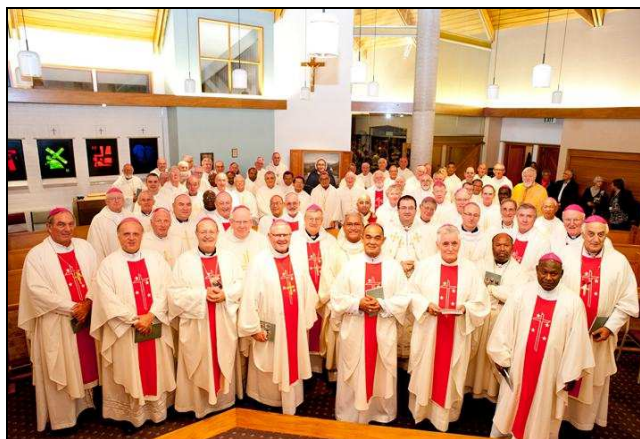
En mai à Wellington, Nouvelle-Zélande, Réunion plénière de la Fédération des Conférences Épiscopales d'Océanie (Australie, PNG-Salomon, N-Z et CEPAC). Au fond, le tableau représentant la Mère Suzanne Aubert, une grande figure fondatrice de l'Église en N-Z., originaire de la paroisse Saint Nizier à Lyon au XIX ème siècle.