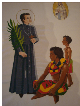
Tableau au Sanctuaire de Cuet

Aujourd'hui, Saint Pierre Chanel est près du Seigneur. N'hésitons pas à lui demander d'intercéder pour nous auprès de Lui.